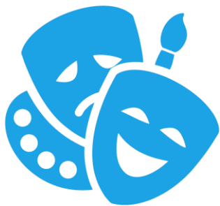
Логотип трека «Орлёнок – Мастер»